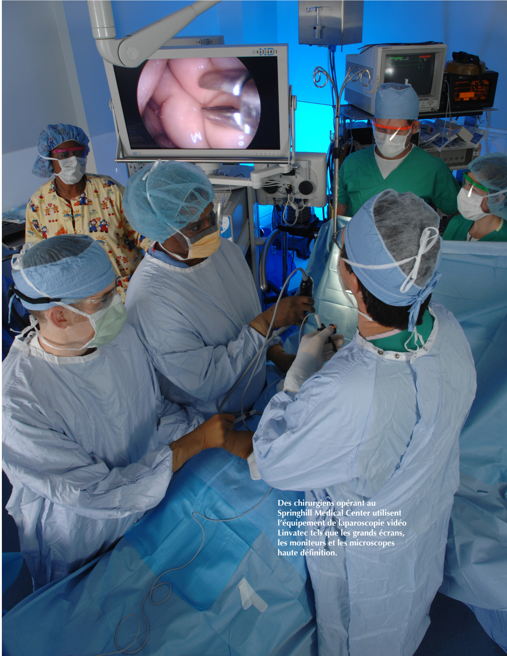
Des chirurgiens opérant au Springhill Medical Center utilisent l'équipement de laparoscopie vidéo Linvatec tels que les grands écrans, les moniteurs et les microscopes haute définition.